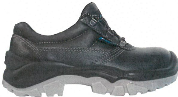
Bild des Grundmodells

Sicherheitsschuhe für den professionellen Einsatz im Einklang mit der harmonisierten Norm (*) EN ISO 20345:2011